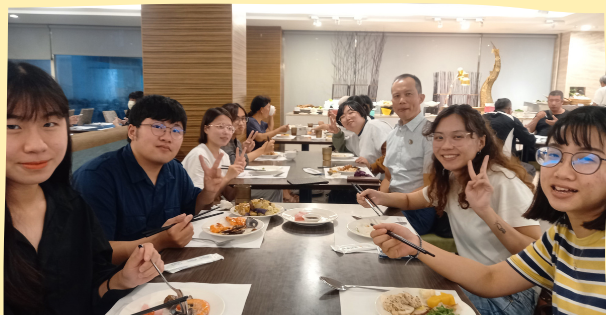
期末聚會—送舊、分享與討論學期心得