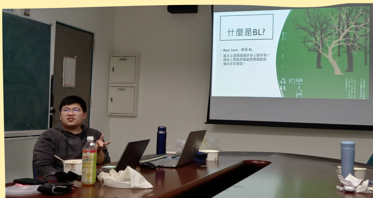
透過小說與影視作品來探究「BL文化」