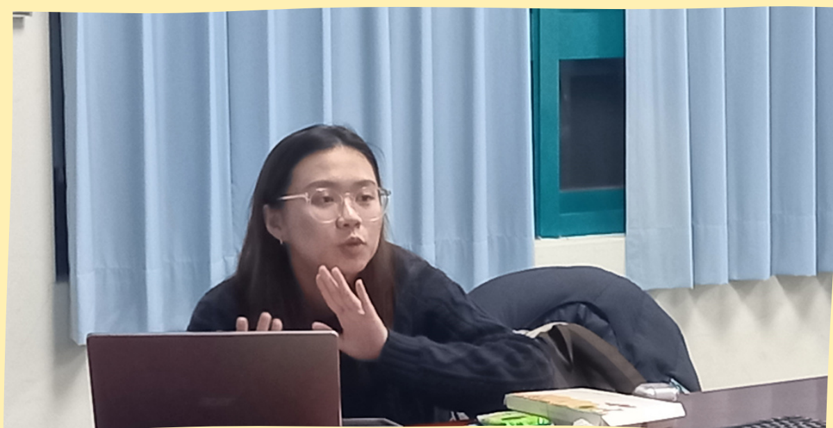
以原住民同志的自述探討其面對的挑戰