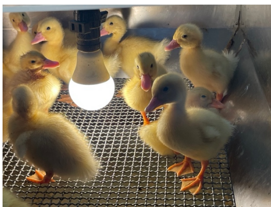
還在等待長大的小鴨

關於宜蘭鴨文化的觀察，最後我們決定前往「鴨寮故事館」、與「博士鴨觀光工廠」拜訪，並且踏查沿路的鴨場。由於同學關注焦點不同，因此以下分別就團隊成員的筆記與討論進行記錄。