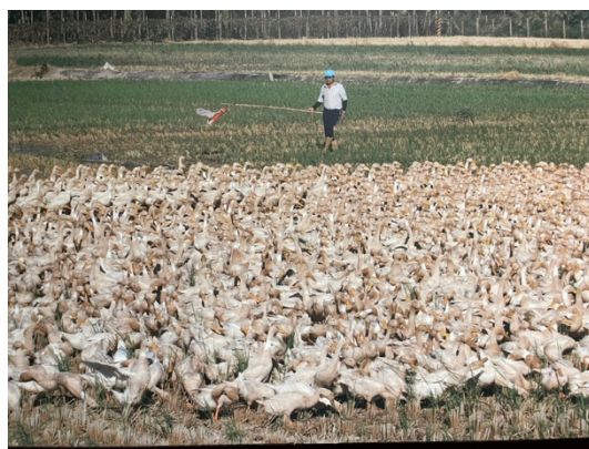
過往「趕鴨」飼養方式