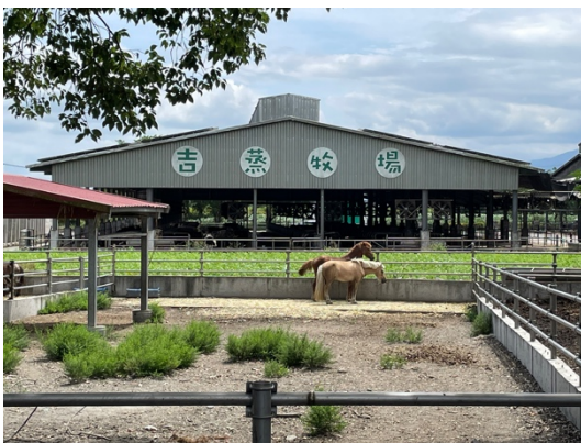
吉蒸牧場觀光區與飼養區的分野

雖然，兩個牧場雖然目前都朝向觀光化經營，但是兩個牧場都很明確地區隔了養殖區以及觀光區在空間上的距離；並且，兩者都將養殖區安置在整個園區相對隱密的區域，用各種標示牌將遊客引離養殖區。事實上，這樣的安排在農牧養殖業上並不少見；許多養殖場謝絕人類拜訪，之前我有課程帶著整班同學拜訪壽豐的養雞小農，小農便曾表達許多人類進出可能引起的「疾病」的考慮，就算讓人類進入養殖場拜訪，都需要全副武裝或做足完整的消毒，免得因為太多的遊客接觸動物，帶進人畜互通的疾病，造成飼養區的浩劫。其次，兩個農場由於觀光化的經營，均在廣大草地上釋放動物與遊客互動。但這些會與人類接觸的動物，都與飼養區的動物隔離飼養，並不會直接進入主要飼養區、或接觸飼養區的動物。