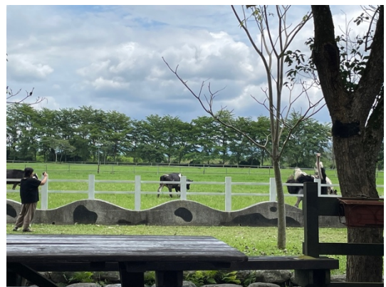
瑞穗牧場與人互動的乳牛

在我們踏查的過程中，團隊們最在意的莫過於經濟動物的「動物福利」問題；在乳牛飼養的議題中，主要與動物福利的問題包含，溫度、鋪料、空間以及糧食的多樣性。雖然我們進行拜訪的時間是五月，但是事實上花蓮已經逐漸炎熱，兩個農場的飼養區均備有大型的風扇對應，我們前往踏查時，所有飼養區的大型風扇也都強力運轉。其次，團隊的同學們均在意鋪料的品質。飼養區鋪料的品質決定了乳牛生活上的福利，不好的鋪料會造成乳牛身體上的損傷，例如蹄，以及環境的髒亂。目前許多國家均以更好清潔的塑膠鋪料取代自然鋪料 (牧草)，但是部分較不注重動物福利的農場會以更簡陋的水泥地，而不佈置鋪料。而我們觀察到兩個農場均以更容易清理的塑膠鋪料，並且設計成為斜坡式的墊面，讓牛隻在進出或休憩時，不至於因鋪料高低差而有所跌損。