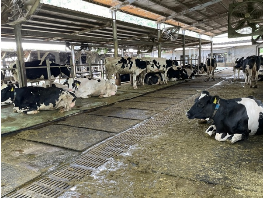
瑞穗牧場的養殖區