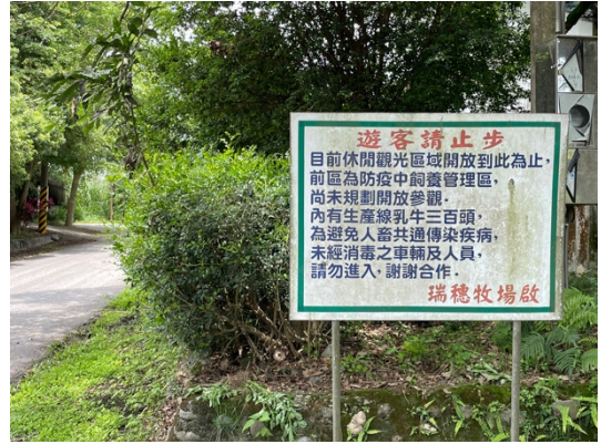
瑞穗牧場養殖區公告看板

雖然，兩個牧場雖然目前都朝向觀光化經營，但是兩個牧場都很明確地區隔了養殖區以及觀光區在空間上的距離；並且，兩者都將養殖區安置在整個園區相對隱密的區域，用各種標示牌將遊客引離養殖區。事實上，這樣的安排在農牧養殖業上並不少見；許多養殖場謝絕人類拜訪，之前我有課程帶著整班同學拜訪壽豐的養雞小農，小農便曾表達許多人類進出可能引起的「疾病」的考慮，就算讓人類進入養殖場拜訪，都需要全副武裝或做足完整的消毒，免得因為太多的遊客接觸動物，帶進人畜互通的疾病，造成飼養區的浩劫。其次，兩個農場由於觀光化的經營，均在廣大草地上釋放動物與遊客互動。但這些會與人類接觸的動物，都與飼養區的動物隔離飼養，並不會直接進入主要飼養區、或接觸飼養區的動物。