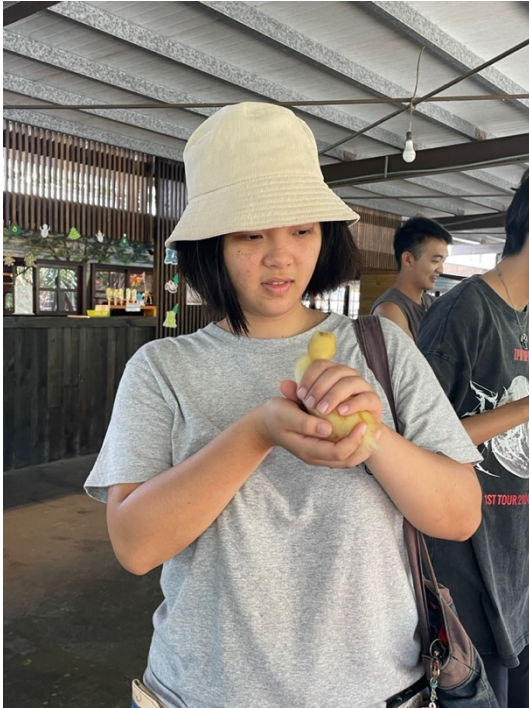
逐漸從經濟動物過渡到同伴動物：柯爾鴨